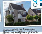
Ons huis in Wijk bij Duurstede. Het is een heerlijk rustige buurt.