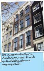
De advocatenkantoor in Amsterdam, waar ik werk op de afdeling milieu- en omgevingsrecht.