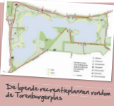
De lokale recreatieplannen rondom de Torenburgerplas