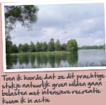
Toen ik hoorde dat zo dit prachtig schapje natuurlijk groen velden gaan belakten met intensieve recreatie kwam ik in actie