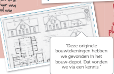
"Deze originele bouwtekeningen hebben we gevonden in het bouw-depot. Dat vonden we via een kennis."

We willen heel graag een aanbouw maken aan ons huis, dan kunnen we daar een mooie slaapkamer plaatsen en een extra logeerkamer.