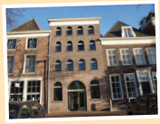
Het Kantoor van de Natuur- en Milieufederatie in Utrecht, waar ik werk.