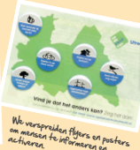
Wij verspreiden flyers en posters om mensen te informeren en activeren.