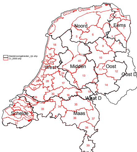
Figuur 4: Nederland verdeeld in (deel)stroomgebieden

Deze paragraaf beschrijft de opbouw van de regionale NAMWA en de methode van samenstelling uit de brongegevens. De regionale NAMWA wordt gescheiden van de nationale NAMWA behandeld omdat niet alle nationale gegevens op regionaal niveau beschikbaar zijn. De regionale economische jaarrekeningen bevatten maar een beperkte hoeveelheid informatie ten opzichte van de nationale jaarrekeningen. Hierdoor is het ook niet mogelijk om de publicatie in de matrixvorm van de nationale NAMWA te gieten, maar worden de variabelen per regio en per bedrijfs categorie gepubliceerd. De regionale NAMWA wordt opgesteld voor 7 (deel)stroomgebieden, d.w.z. de vier grote rivieren, te weten het stroomgebied van de Schelde, de Rijn, de Maas en de Eems, waarbij het Rijnstroomgebied verder is opgedeeld in vieren: West, Noord, Oost en Midden (zie figuur 4). De variabelen in de regionale NAMWA kunnen verdeeld worden in twee groepen, namelijk een economisch deel en een deel met emissies. Hieronder wordt de inhoud van deze drie delen besproken en de wijze waarop regionale gegevens geaggregeerd zijn.