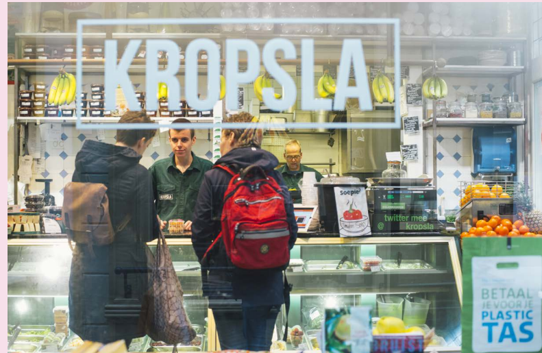
Groentehandel Kropsla in Alkmaar

Ook voor niet-ruimtelijke thema's zoeken gemeenten oplossingen in