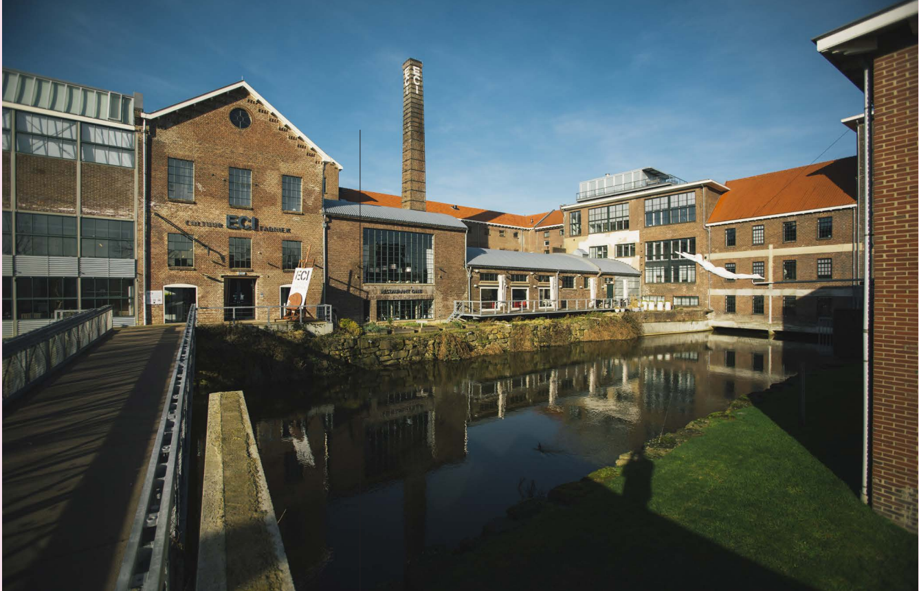
ECI Cultuurfabriek in Roermond

regionale samenwerkingen. Alphen aan den Rijn zoekt bijvoorbeeld expliciet de samenwerking op rond het thema Gezonde duurzame samenleving. Alphen vindt gezondheid een belangrijke waarde en is zich ervan bewust dat ze hierbij andere organisaties in de regio nodig heeft, zoals de GGD en de veiligheidsregio en buurgemeenten.