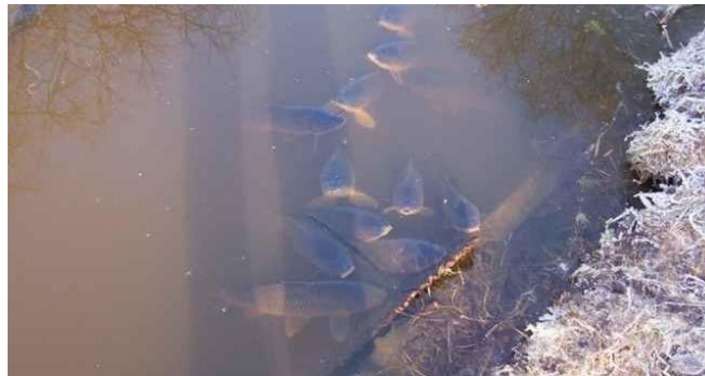
Naar zuurstof happende karpers