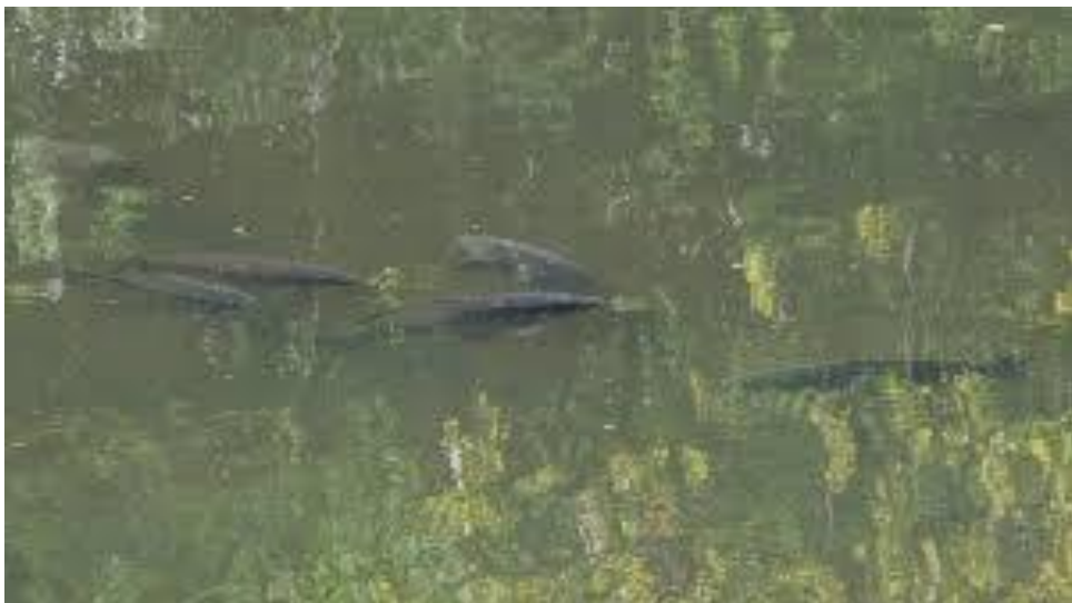
Zonnende / azende karpers