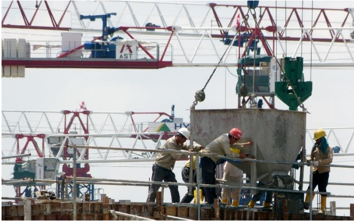
Interactie ADS en bedrijfsleven DSO Werkplaatsen