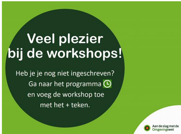
Evenementen en communicatie ook voor het bedrijfsleven